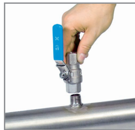
A Tubuladuras roscadas

Con ayuda del dispositivo de taladrado se pueden perforar bajo presión con la válvula de bola 1/2" en la tubería existente. Las virutas de perforación se recogen en un filtro. Después se monta la sonda como se ha descrito antes en 1).