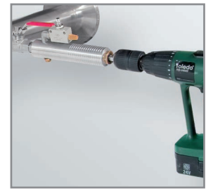
Perforación bajo presión con el dispositivo de perforación de CS

3) Gracias al amplio rango de medición de las sondas se pueden cumplir incluso las exigencias extremas de la medición de consumo (alto caudal en diámetros de tubo pequeños).